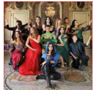
THEATER COMPANY DELLA LUNA