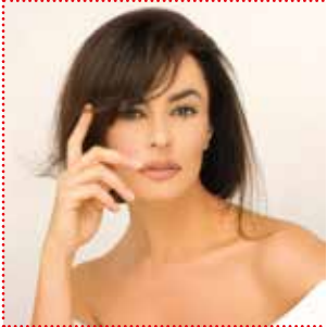
MARIA GRAZIA CUCINOTTA